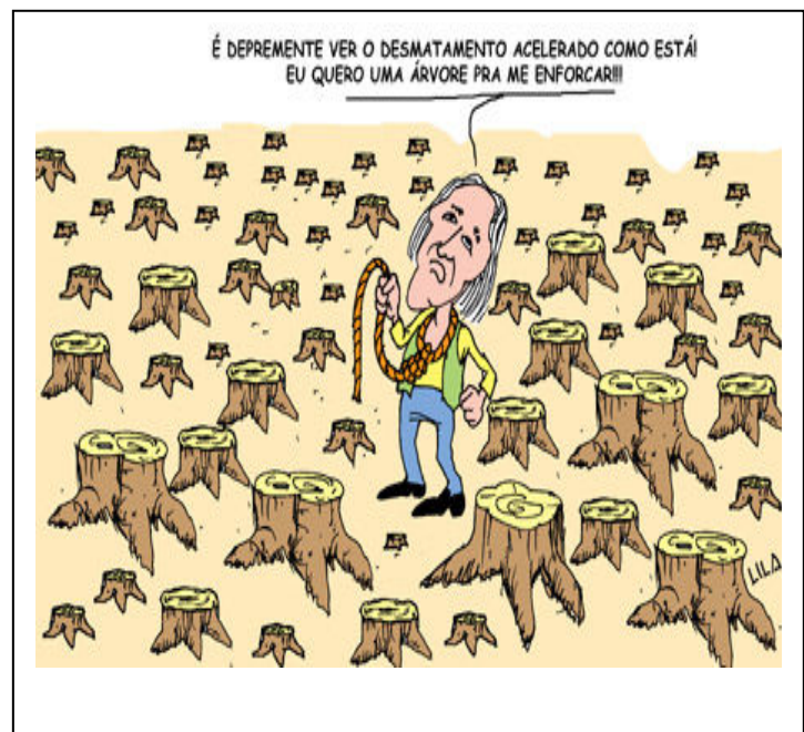
Esta charge do Lila foi feita originalmente para o Jornal da Paraíba