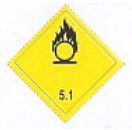
(Nº 5.1) CLASSE 5.1 - SUBSTÂNCIAS OXIDANTES Símbolo - chama sobre círculo em preto Fundo amarelo número 5.1 no canto inferior