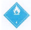
(Nº 4.3) CLASSE 4.3 - SUBSTÂNCIAS QUE EM CONTATO COM A ÁGUA EMITEM GASES INFLAMÁVEIS Símbolo - chama preta ou branca Fundo azul número 4 no canto inferior