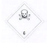
(Nº 6.1) CLASSE 6.1 - SUBSTÂNCIAS TÓXICAS Símbolo - caveira em preto Fundo branco número 6 no canto inferior