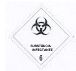
(Nº 6.2) CLASSE 6.2 - SUBSTÂNCIAS INFECTANTES A metade inferior da etiqueta deve ter a inscrição SUBSTÂNCIA INFECTANTE e em caso de dano ou vazamento comunicar imediatamente a autoridade de saúde pública. Símbolo: três meia-luas crescentes superpostos em um círculo e inscrições em preto Fundo branco número 6 no canto inferior